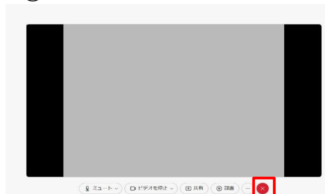
① パソコンの退出画面