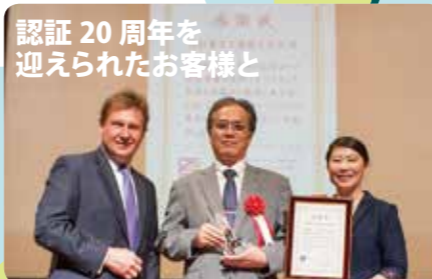
認証 20 周年を迎えられたお客様と

感情論で動く人間の本質を「やる気」のマネジメントとして理論的に説明されていて大変興味深かった。