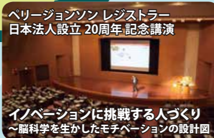
ペリージョンソン レジストラー 日本法人設立 20周年 記念講演