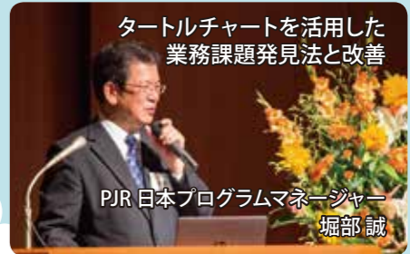
タートルチャートを活用した業務課題発見法と改善